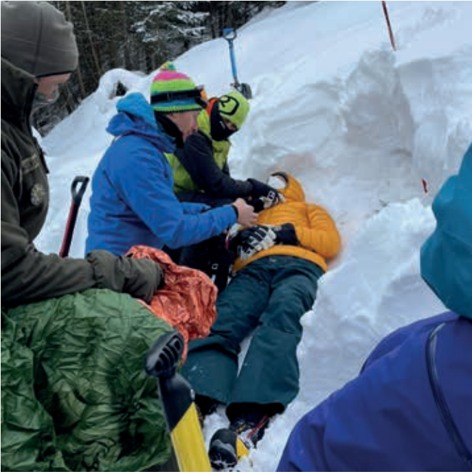
Übung der Versorgung eines verschütteten Lawinopfers