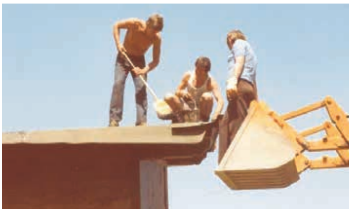
Juli 1981 – Abdichtung Dach

Nach fast 40 Jahren hat das alte Zielhaus nun seine Funktion aufgegeben – hier ein paar Eindrücke, wie anno dazumal fleißig Hand angelegt wurde