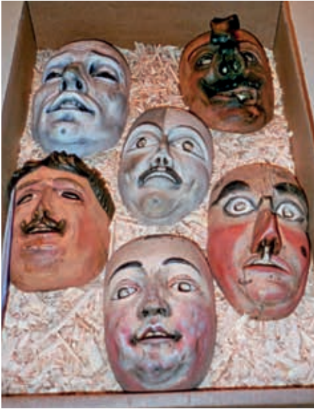
Die 6 gelungenen Duplikate der Tulfer Fasnachtsmasken, deren Originale im Wiener Volkskundemuseum aufbewahrt werden

Könnte man bisher nur in der Fasnachtszeit bei diversen Faschingsveranstaltungen und Umzügen Masken aller Art betrachten und bewundern, so herrscht nun schon seit Monaten wegen der Coronapandemie generelle Maskenpflicht in allen geschlossenen öffentlichen Räumen und Verkehrsmitteln. Wird man ohne entsprechende einheitliche Maskierung (FFP2) erwischt, droht eine strenge Bestrafung.