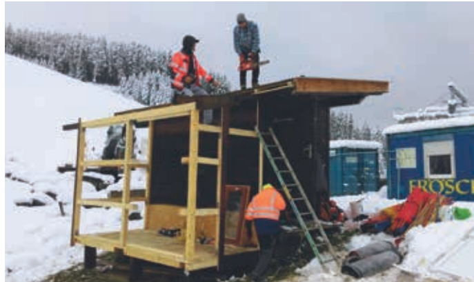
Abbrucharbeiten beim alten Zielhaus bei „besten“ Wetterverhältnissen