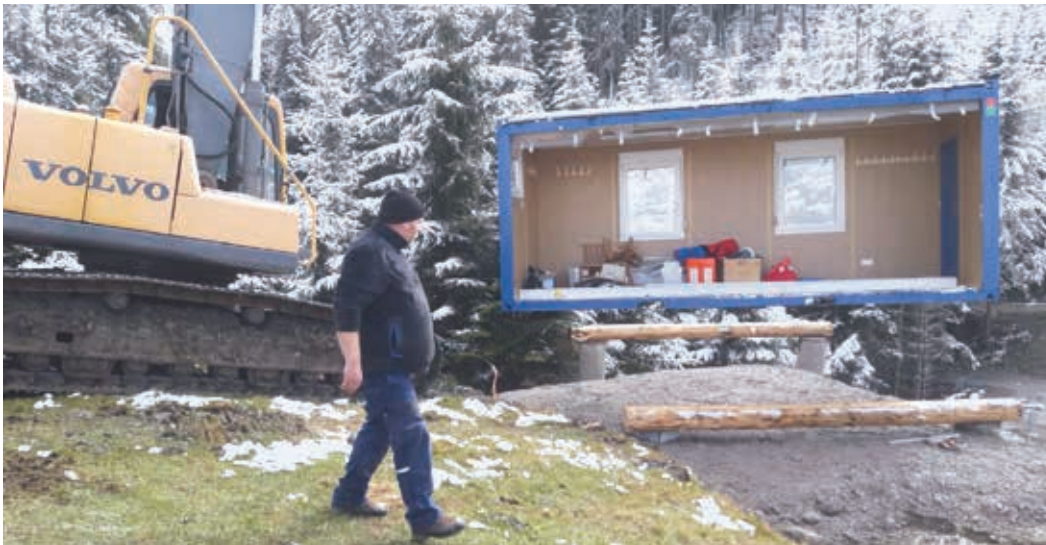
Die Lagercontainer werden positioniert