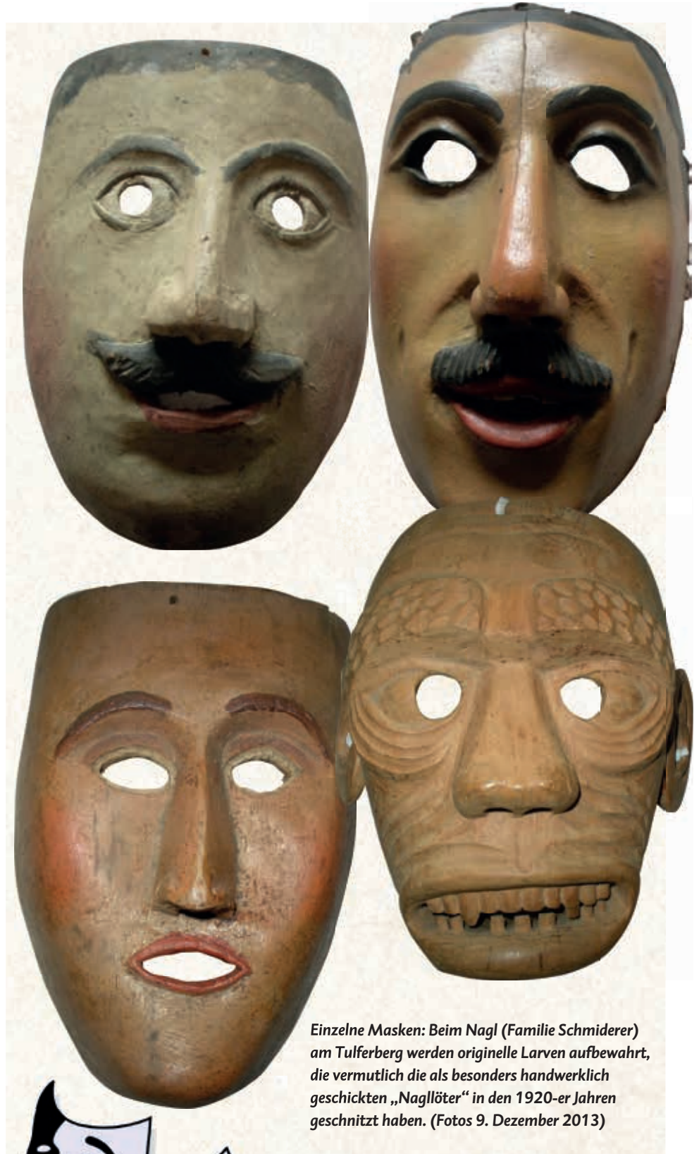
Einzelne Masken: Beim Nagl (Familie Schmiderer) am Tulferberg werden originelle Larven aufbewahrt, die vermutlich die als besonders handwerklich geschickten „Nagllöter“ in den 1920-er Jahren geschnitzt haben. (Fotos 9. Dezember 2013)