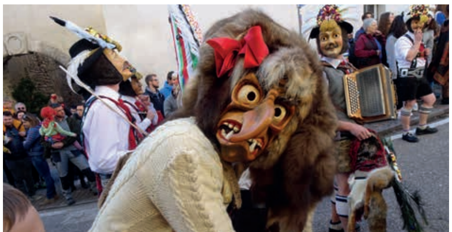
Tulfes Hexe beim „Maschgrauzug“ in Kurtatsch am 15. Februar 2020