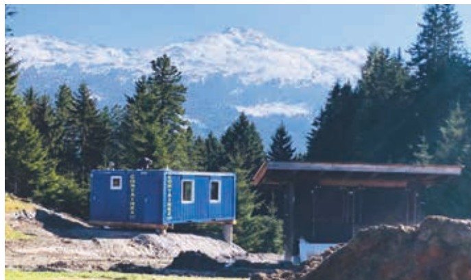
Altes und neues Zielhaus Das alte Zielhaus wird verladen