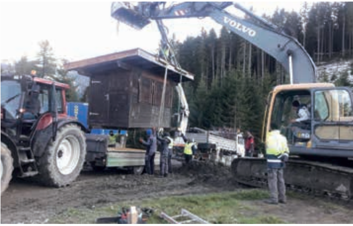
Abtransport altes Zielhaus