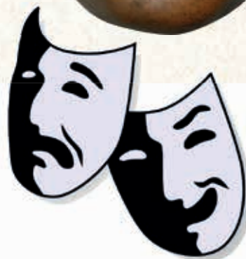
Masken als Symbol für das Theaterspiel: Tragödie und Komödie