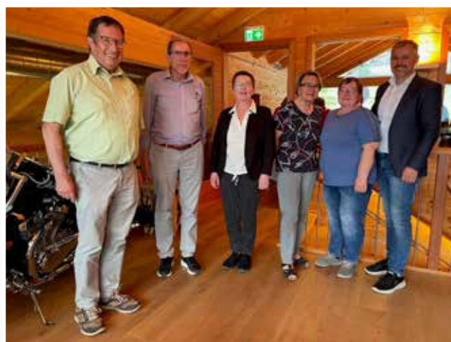
Abordnung der Bezirkschronisten, 2024