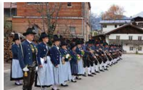
vor der Ehrensalue zum Kriegergedenken

A m ersten Sonntag nach Allerheiligen, dem 9. November, feierte die Speckbacher Schützenkompanie Tulfes ihren Schützenjahrtag mit anschließender Generalversammlung.