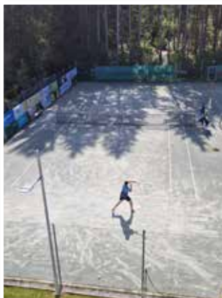
Finale Herren Einzel Allgemeine Klasse