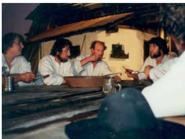
Aufführung Räuber vom Glockenhof, 1992