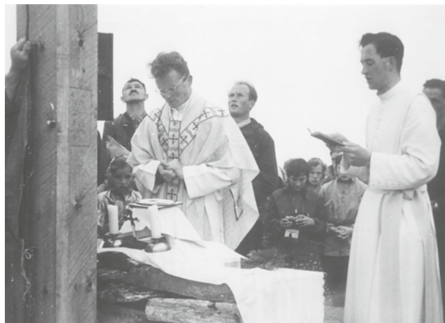
Einweihung Glungezer Gipfelkreuz, 1956

* Zudem pflegt er wichtige Kontakte zu anderen Chronisten, Museen und Archiven, etwa durch die Organisation des Krippele-Schaugns der Bezirkschronisten in Tulfes im Jahr 2024.