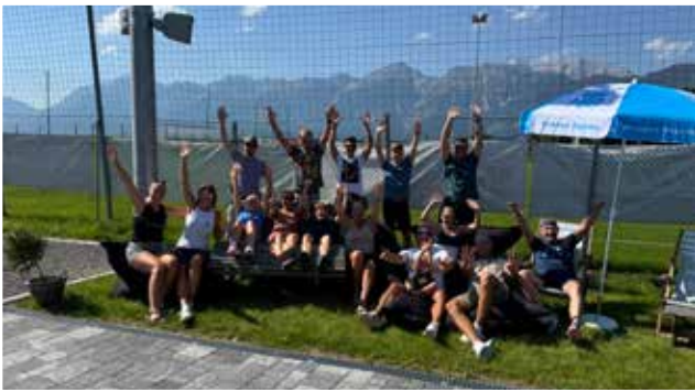
Bier & Prosecco-Cup

Nach intensiven und erfolgreichen Einsätzen bei den Tiroler Mannschaftsmeisterschaften im Mai und Juni standen umgehend die internen Vereinsmeisterschaften an. Diese wurden, wie auch schon in den letzten Jahren, größtenteils als Langzeitwettbewerbe über die Sommermonate hinweg durchgeführt.