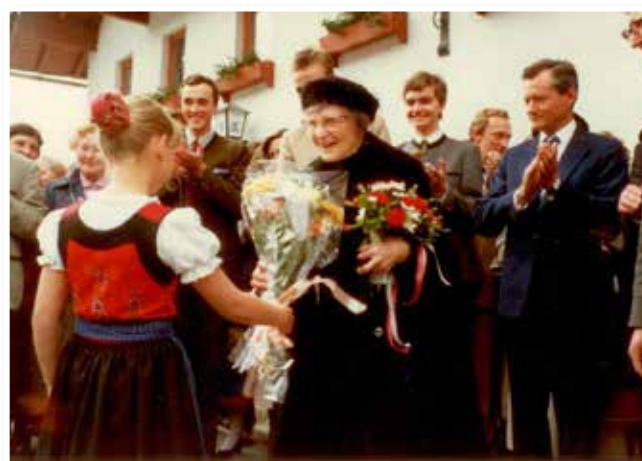
Besuch der Kaiserin Zita, 1983