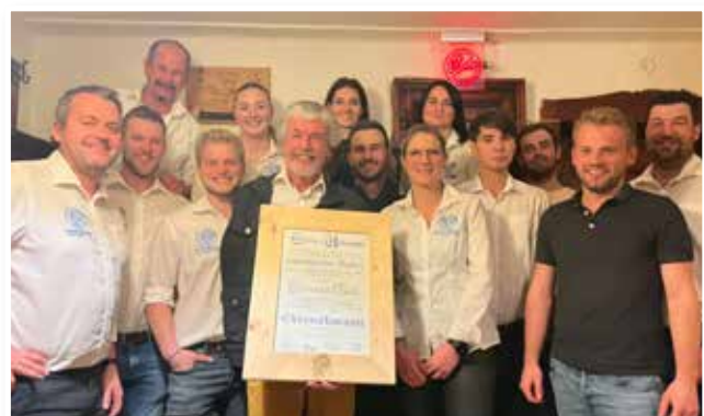
Der neue Ausschuss

SPORTVEREIN TULFES am Glungezer gegründet 1938