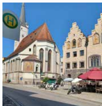
Marienkirche in Wasserburg am Inn

ging es um 13:00 Uhr weiter zum Erlensee, etwa 20 Kilometer entfernt. Der idyllische Baggersee mit Grundwasserzufluss und Moorbadeseesee lud zu einem Spaziergang