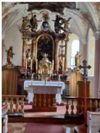
Pfarrkirche Hl. Lambert in Steinberg am Rofan

Um 17:00 Uhr trat die Gruppe die Heimreise an. Der Ausflug war ein voller Erfolg – ein netter Tag in geselliger Runde und ein schönes Stück Tirol, das allen in guter Erinnerung bleiben wird.