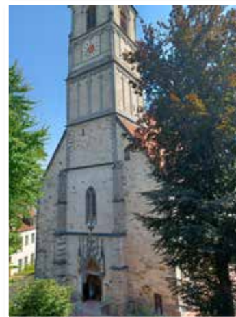
Jakobskirche in Wasserburg am Inn.

Die Wanderung zur Annagrotte auf 1.133 m Seehöhe war ein High-