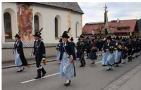
Schützenkompanie beim Einzug zum Schützenjahrtag 2025