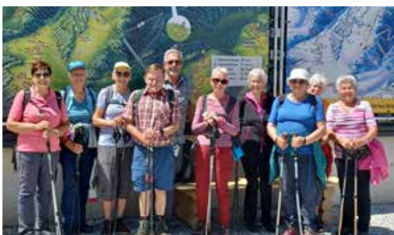
Wanderung Rosskogl Hütte

Die zweite Wanderung führte die Gruppe am 17. Juli zur Rosskoglhütte bei Oberperfuss. Insgesamt nahmen 10 Wanderer und ein Radfahrer teil. Mit der Bergbahn ging es zunächst bis zur Station Sulzstich, von wo aus die Gruppe eine rund einstündige Wanderung zur Rosskoglhütte auf 1.778 m Seehöhe unternahm.