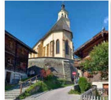
Wallfahrtskirche Maria Schnee