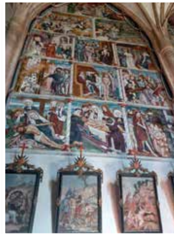
Fresken in der Wallfahrtskirche

vermittelte. In der Kirche fallen sofort die prunkvollen, farbenprächtigen Fresken von Simon von Taisten auf, welche die Wände der Kirche zieren.