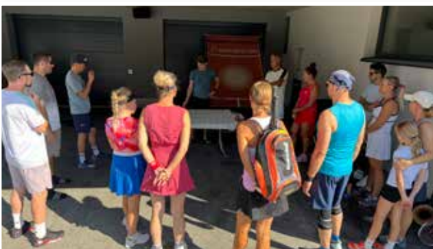
Spielbesprechung Bier & Prosecco-Cup