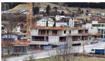
Bau Haus der Generationen, 24. März