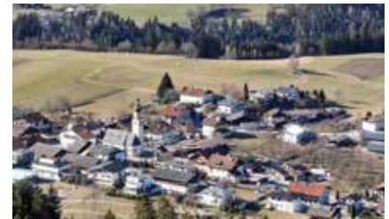
„Schneelage“ im Dorf am 4. März