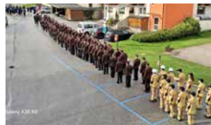
Florianifeier der Feuerwehr, Aufstellung zum Kirchgang, 4. Mai