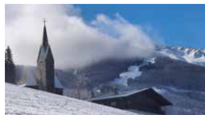
Blick auf die Glungezerabfahrt, 27. Februar

Der Februar wird von den Meteorologen als zu warm und zu trocken bewertet mit wenig Schnee.