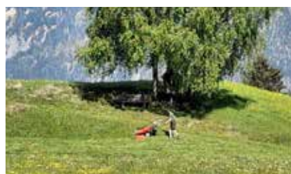
Erste Mahd bereits am 29. April beim Umerkruz