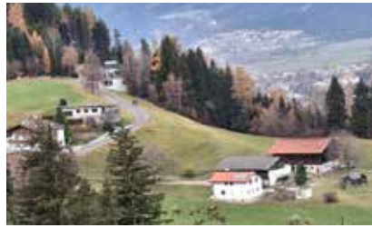
Blick auf den Bereich Haller und Auffahrt nach Gasteig, 16. November

Am 11. November Martinifeier des Kindergartens beim Vereinshaus Erster Schnee fällt am 20. November, weitere ca 10-15 cm am 25. November Cäcilienfeier der MK mit Festmesse im Gemeindesaal und Feier beim Tuxer am 23. November Herbstkonferenz des Bauernbundes