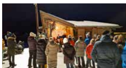
„Zaungeschichten“ bei der Klumperhütte am 7. Dezember

Die Glungezerbahn startet am 6. Dezember bei guter Schneelage in die Wintersaison 2025/26