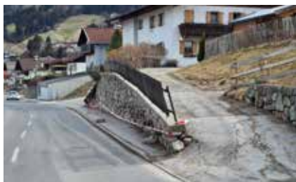
Die Stützmauer beim Tuxer neigt sich bedrohlich, 21. März