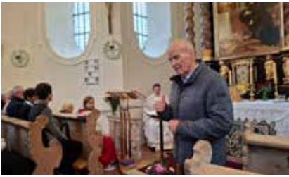
Patrozinium Borgiaskirche am 5. Oktober, Konrad Steinlechner

Wegen Straßenbauarbeiten im Bereich Volderwaldhof – Glockenhof wird der Verkehr von Oktober bis Dezember mittels Ampel geregelt.