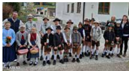
Grasausläuter am 21. April

Am Ostermontag, 21. April, stirbt Papst Franziskus im Alter von 88 Jahren Am Ostermontag ziehen traditionell die Grasausläuter (20 Kinder) durch das Dorf.