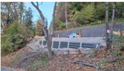
Hangsicherungsarbeiten an der Landesstraße zwischen Volderwaldhof und Glockenhof, 21. Oktober