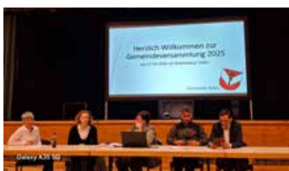
Gemeindeversammlung am 27. März