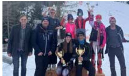
Vereinsmeisterschaft am 9. Februar, Siegerfoto