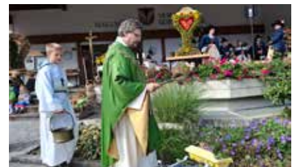
Erntedankfeier am 28. September

Am 21. September 50-Jahr-Jubiläumsmesse im Gedenken an Josef Speckbacher im Voldertal, veranstaltet von den Speckbacher Schützen aus Hall und Tulfes Erntedankfest mit Frühschoppen und Basar am 28. September beim Vereinshaus