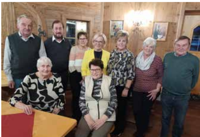
Geburtstagsfeier des Seniorenvereins Tulfes/Volderwald beim Tuxer