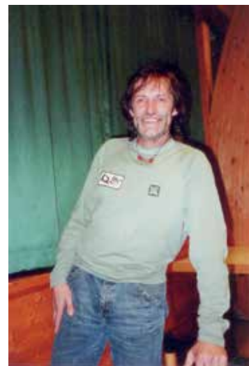
Hans Kammerlander beim Vortrag im Tulfen Gemeindesaal vor 20 Jahren am 30. März 2006

Unter diesem Titel hielt Hans Kammerlander, gebürtig aus Ahornach im Südtiroler Ahrntal und einer der weltbesten Extrembergsteiger, am 30. März 2006 auf Einladung der Vereinshauspächter (Eventgastro GmbH) einen spannenden und interessanten Vortrag im Tulfen Gemeindesaal. Die Bilder aus der Südtiroler Bergwelt begeisterten die zahlreichen Besucher genauso wie die Bildberichte von seinen Expeditionen im Himalaya, wo er 12 der 14 Achttausender, sieben davon gemeinsam mit Reinhold Messner, ohne Zuhilfenahme von Sauerstoff erstiegen hat. Als erstem Menschen gelang ihm 1990 die Skiabfahrt vom Nanga Parbat, 1996 folgte die vom Gipfel des höchsten Berges der Welt, dem Mount Everest. Der erfahrene Alpinist war am 19. Februar 2026 als Experte Gast in der neuen Fernsehserie „Hinter den Schlagzeilen“, bei der er unter anderem auch zum Drama am Großglockner vom Jänner 2025 Stellung genommen hat.