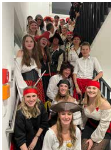
gefährlich musikalisch.... Unsere Piraten entern den Maskenball im Feuerwehrhaus

Der Fasching ist vorbei, die Karibik liegt hinter uns. Längst sind wir wieder in die Probenarbeit für's Frühjahrskonzert durchgestartet – ihr dürft euch auf ein anspruchsvolles Programm freuen. Wir MusikantInnen tasten uns langsam an die Melodien heran und auch unser KapellmeisterInnenteam startet mit Schwung und Freude in die Probenarbeit.