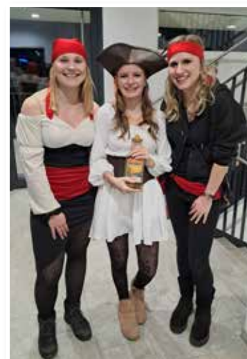
Die Einstimmung auf „Tequila“ mit...? Tequila!