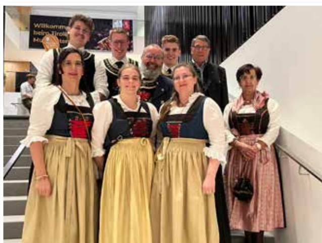
unsere „Besten auf Festen“ – feiern tags drauf gleich weiter: auf dem Tiroler Musikantenball