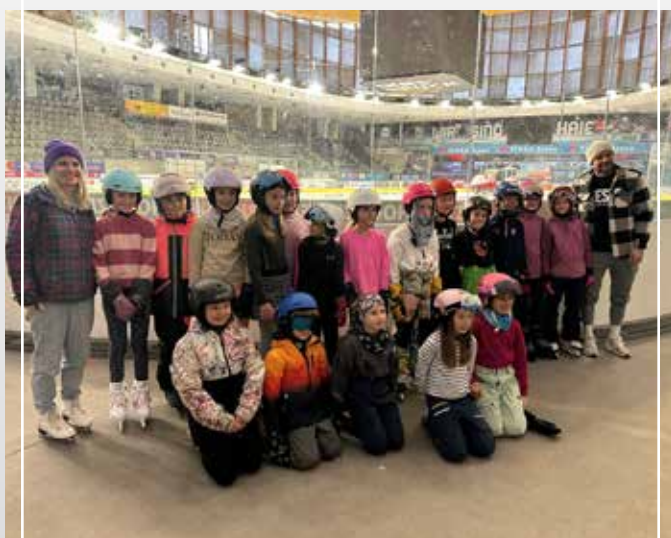
Die 3. Klasse machte einen Ausflug zur Olympia World zum Eislaufen