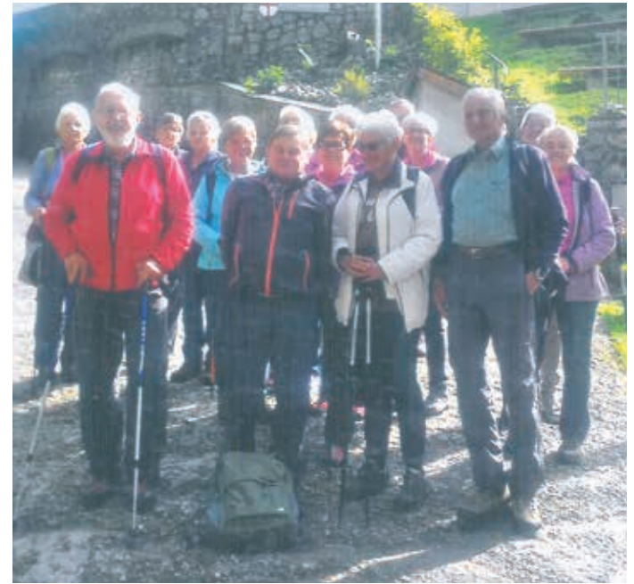
Bei der Wanderung auf Georgenberg

Auch in diesem Sommer veranstaltete der Seniorenverein