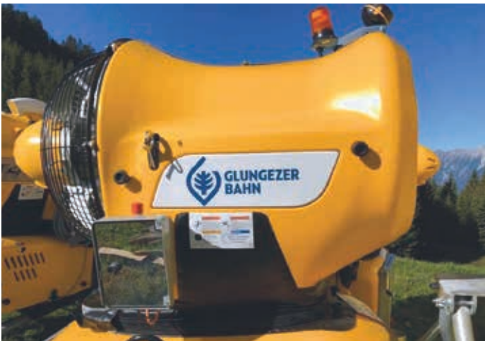
Schneekanone der Firma Technoalpin