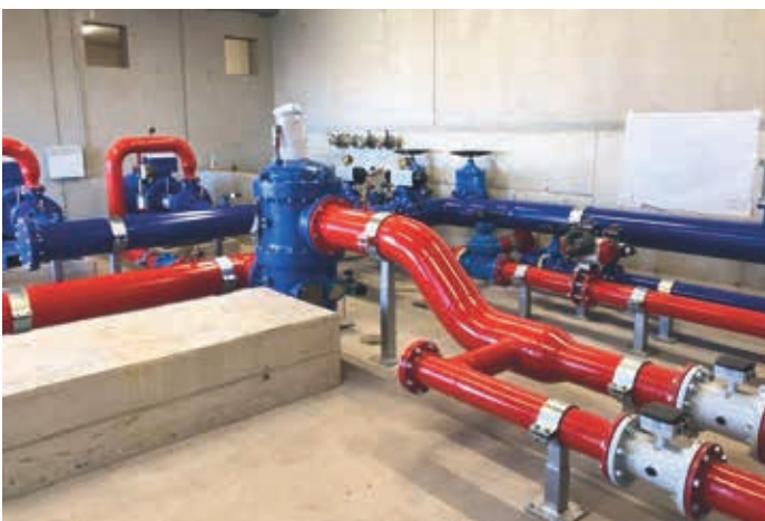
Einblick in die Pumpstation Tulfein