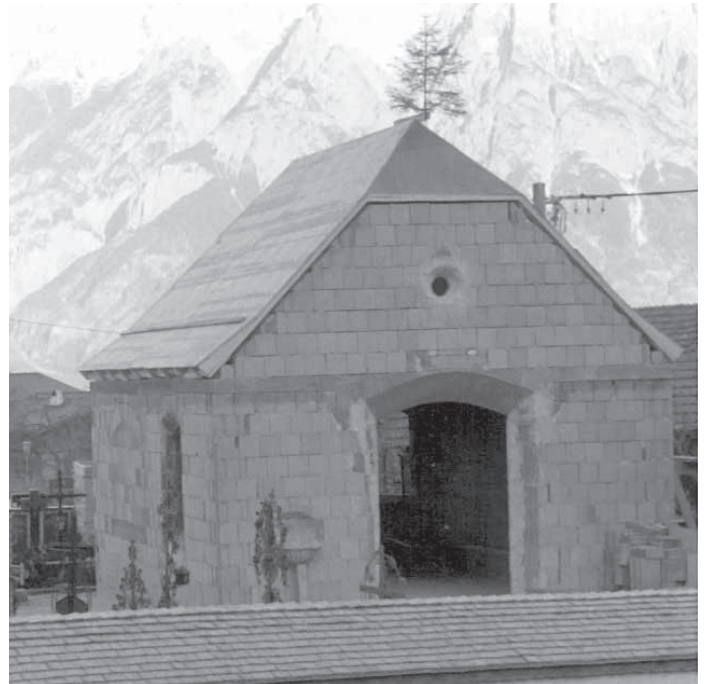
Der Rohbau steht – November 1993