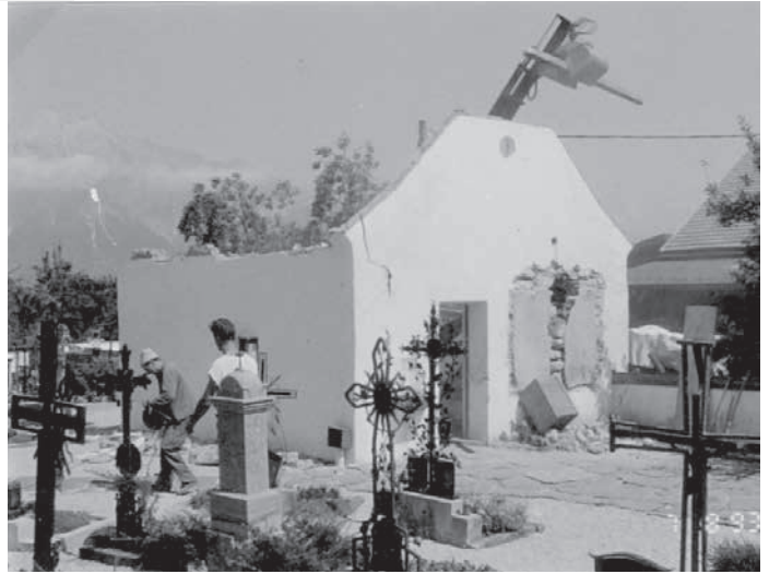
Abbruch mit LKW-Kran (Herbert Klapeer) am 7. August 1993