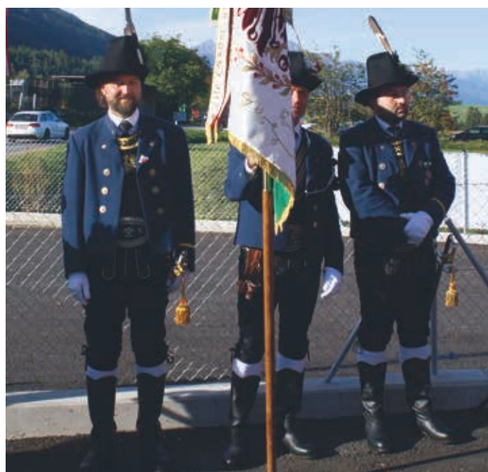
Fahnenabordnung der Schützenkompanie Tulfes