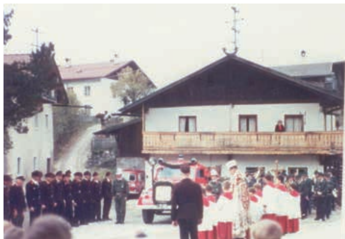
Fahrzeugweihe des Opel Blitz am 12. November 1967