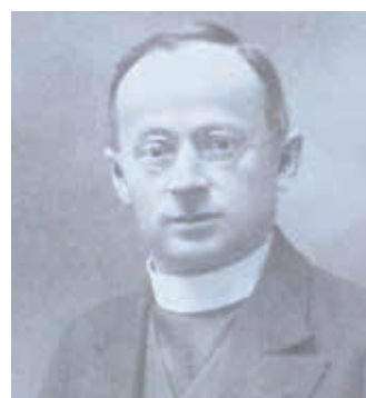
Otto Neururer war der erste katholische Priester, der von den Nazis ermordet wurde und dessen Asche in der Götzner Pfarr- und Wallfahrtskirche und auch an anderen Orten wie z. B. im Innsbrucker Dom aufbewahrt wird.