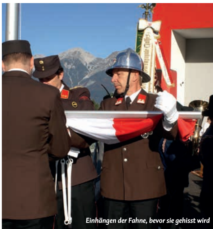
Einhängen der Fahne, bevor sie gehisst wird

Alle Fotos zur Einweihung auf www.ff-tulfes.at