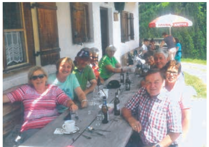
Bei der Wanderung auf der Stiftsalm