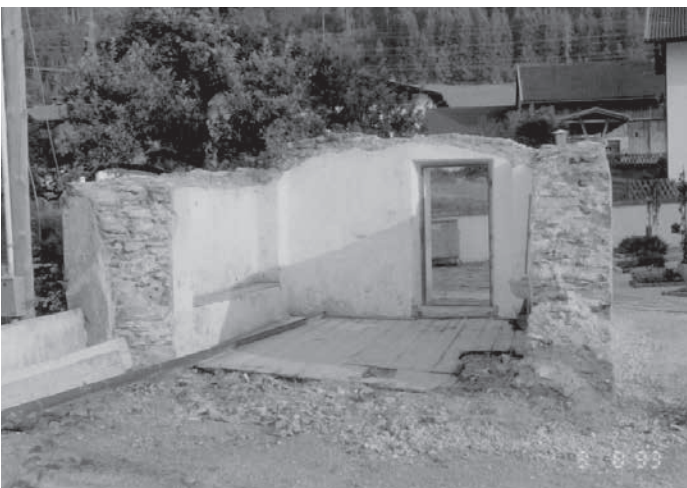
Die Mauerreste müssen laut Denkmalamt (vorerst) noch stehen bleiben – 9. August 1993