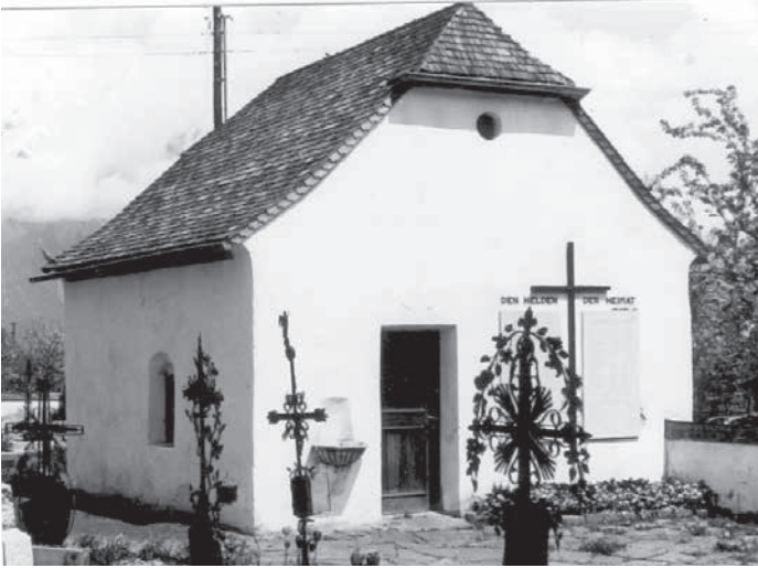
Die alte Kapelle mit dem Kriegerdenkmal im Jahr 1978, zuletzt renoviert im Jahr 1961