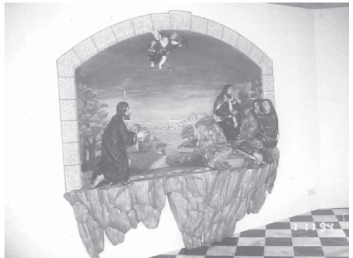
Die von Restaurator Willi Ghetta und seinem Sohn Stefan renovierte und neu gestaltete Ölberggruppe – 1. November 1994